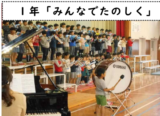
1年「みんなでのしく」

なお、今回発表ではなかった2・4・6年生は、2月の参観時を中心に、生活科や総合的な学習の時間を使って、学んだことや成長の喜びを披露させていただき予定です。よろしくお願ひいたします。