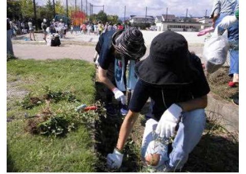
お手伝いいただいた保護者の皆様

8月29日の2校時、「きれいな学校づくり」に向けた特別活動（勤労生産奉仕的行事）の一環として、除草作業を行いました。各学年ともそれぞれの持ち場で丹念かつ一生懸命に仕事に励んでいました。晴れて気温が上昇するなかでしたが、子どもたちはとてもがんばりました。また、今回の除草作業にあたっては、多数の保護者の皆様のご参加を得て、子どもたちだけでは十分ではない部分を補っていただきました。ご協力いただきました皆様、本当にありがとうございました。心よりお礼申し上げます。