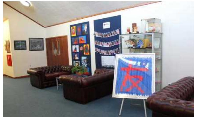
レンジビュー・インターメディエイト・スクールのロビー

海外の学校と姉妹校関係を締結している福岡市の学校は、全体の5分の1程度、その中で活発に交流を続けている学校は、限られています。そのメリットを最大限に生かすとともに、今後とも友情の輪を拡げていきたいものです。