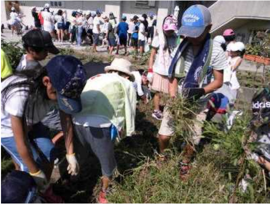
暑い中がんばりました

8月29日の2校時、「きれいな学校づくり」に向けた特別活動（勤労生産奉仕的行事）の一環として、除草作業を行いました。各学年ともそれぞれの持ち場で丹念かつ一生懸命に仕事に励んでいました。晴れて気温が上昇するなかでしたが、子どもたちはとてもがんばりました。また、今回の除草作業にあたっては、多数の保護者の皆様のご参加を得て、子どもたちだけでは十分ではない部分を補っていただきました。ご協力いただきました皆様、本当にありがとうございました。心よりお礼申し上げます。