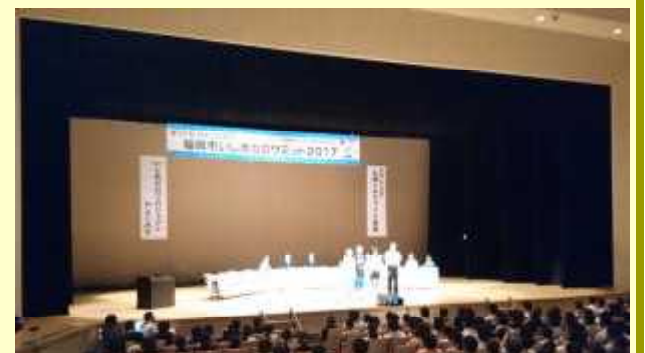
南市民センターで開催されたいじめゼロサミット

いじめゼロサミットでは、各学校が1年間を通して実行した「いじめゼロ」に向けた活動を紹介するとともに、次の1年に向けた取組内容についての協議が進められました。姪浜中学校ブロック(姪浜中 姪浜小 愛宕小 愛宕浜小 姪北小)の5校は、「絆プロジェクト」と名付けられた学校ごとに創意工夫をこらした活動を展開することで合意。具体的な内容については、今後、それぞれの学校で話し合いを進め、実効性の高い内容へと高めていくことにしました。愛宕浜小学校では、「自分のよさや友達によさに目を向けること」から始めたいと考えています。