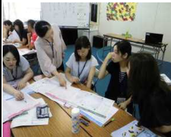
講師を招聘して実施した校内研修

そのような流れの中、私たちは、「子どもたちが社会に出てから5年後10年後を見据えて今やれるだけのことはやっておきたい」という気持ちを胸に、この夏休み期間中、当面の課題である「小学校英語科」や特別な教科「道徳」の実施に向けた研修、人権教育や特別支援教育、さらには、学校の危機管理に関する研修等を中心に学びを深めるとともに、2学期の授業の準備に力を注ぎました。