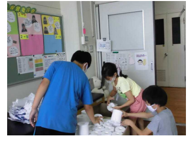
【補充用トイレトイレットペーパーを準備する保健委員会】