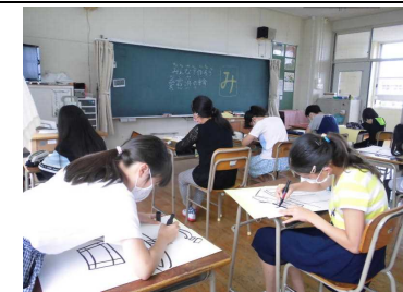
【いじめゼロローグンを作成する計画集会委員会】