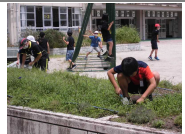
【花壇の手入れに励む生物委員会】

新しい学校生活様式の中、どの委員会も3密にならないよう、全校みんなの役に立てるよう工夫しながら活動を行っています。 特に5年生は初めての委員会活動でしたが、6年生が上手にサポートしてくれて、どの委員会も協力して活動することができています。昼休みに学校を巡回していると5・6年生が学校生活を支えてくれていることを実感するシーンに毎日毎日たくさん出会うことができました。 例えば、体育委員会は体力アップタイム（全校ビデオ放送）に流すオリジナルストレッチ体操を週替わりで作成し、全校みんなを楽しませながら、体力向上に貢献してくれています。 どの委員会も頼りになる、愛宕浜小自慢の5・6年生です！