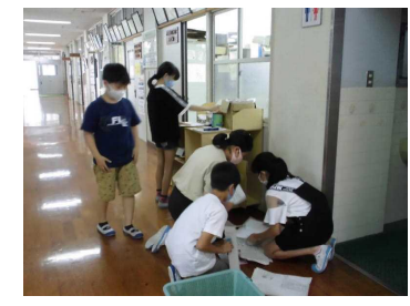
【リサイクルの世話をする環境委員会】