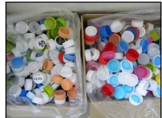
ボトルキャップ集め