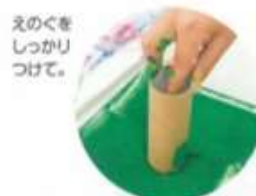
えのぐを しっかり つけて。