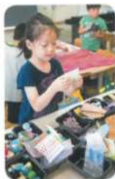
どんな かたちが うつせそうかな。