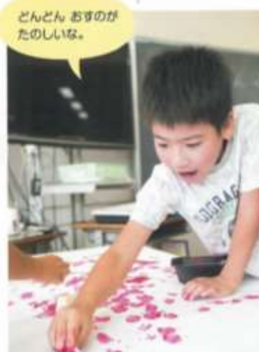
どんどん おすのが たのしいな。