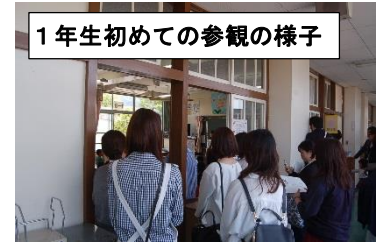
1年生初めての参観の様子

平成30年度初めての学習参観が行われました。「新しい学年」になっての参観。「新しい友だち」「新しい先生」と一緒に「新しい教室」で張り切って学習していました。当日はたくさんの保護者の皆様にお越しいただきました。ありがとうございました。