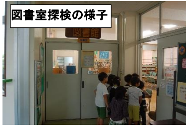
図書室探検の様子

2年生が、1年生を連れて学校探検をしました。職員室、保健室、校長室、図書室、体育館、音楽室、給食室などを案内しました。2年生は、それぞれの部屋で、「何という部屋なのか」「だれがいるのか」「どんなことをする部屋なのか」などを伝えていました。