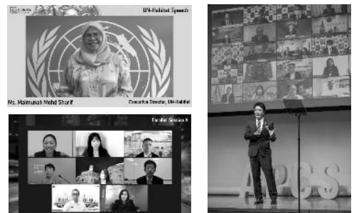
【2021年10月に開催された、第13回アジア太平洋都市サミット特別版の様子】

今月の給食では、都市サミット参加国である中国の料理「ジャージャー麺」を取り入れています。