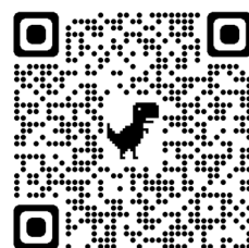
12月参観アンケート用QRコード

かいとうきげん がついつち もく いつか げつ 【回答期限 12月1日（木）～5日（月）】