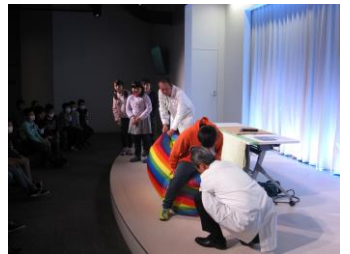
〔楽しい科学ショー〕

先週11日(木), 4年生が中央区六本松に新しくできた福岡市科学館での一日学習に参加しました。福岡市によると、福岡市科学館は最新のドームシアター(プラネタリウム)等の施設を持つと同時に、ユニークな活動プログラムをもつ全国的に見ても大変まれな施設ということです。昨年10月のオープン以来、予想を大幅に超える40万人以上の入場者がすでに入館しているそうです。科学に関するショーを見たり、美しい星空をプラネタリウムで眺めたりと4年生にとって楽しくて思い出に残る一日となったようです。