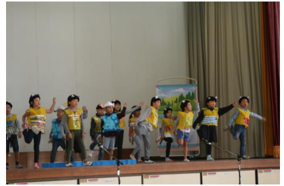
〔1・2年生 35匹の北崎にゃんこ〕