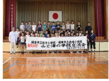
【北崎小と秋月小の5年生】

24日（火）に本校5・6年生児童と朝倉市立秋月小学校の5・6年生が交流する「海山交流学習」が今年も行われます。平成16年度から始まり、現在まで続いています。海と山の地域に住む子ども達が年に一度交流を行っています。秋月の子ども達（5年）は北崎で釣り体験やシュノーケリング体験を、北崎の6年生は秋月で川遊びやそうめん流し、和紙作り体験などを行います。昨年からは4年生での交流学習（秋と一緒にダム見学）も始まり、年に一度しか会わない子ども達ですが、30分もすればすっかり友