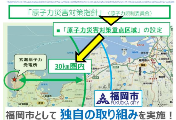
◆原子力災害対策の在り方

これまで、福岡市内の小中学校では原子力災害を想定した避難訓練は行われていませんでしたが、平成30年に策定された「福岡市原子力災害避難計画」に則り、公立学校等においても避難訓練の在り方が検討されています。災害が想定される場所は、玄海原子力発電所とされており、福岡市は玄海原発から30km以上離れているため、緊急の避難などは考えにくいですが、放射性物質を含んだ大気（放射性プルーム）が到達する危険はあるため、屋内退避の仕方について訓練する必要があるとのことでした。