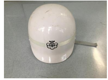
《北中生も使うヘルメット》