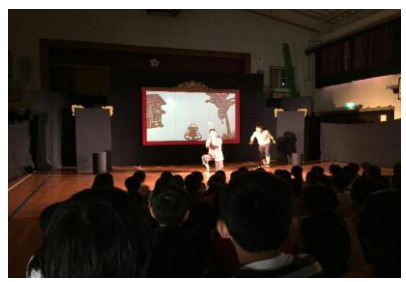
《影絵劇バンバンとトラ》

1日（金）に芸術鑑賞会として、劇団風の子九州の「バンバンとトラ」という劇を全校で鑑賞しました。影絵と劇が合体したような形式の劇で、子ども達も食い入るように劇に入り込んでいました。プロの劇団員の身振りや歌声という本物に出会えるよい機会となったことだと思います。当日は、3人の劇団員さんだけで、全ての役をこなして、そのこと自体もすごいことだと思いました。