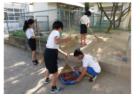
【「継続は力なり」長く続けてね！】

できる日に、できる時間でいいので、“長～く、細～く”続けてほしいものです。自分の心の成長のために・・・。