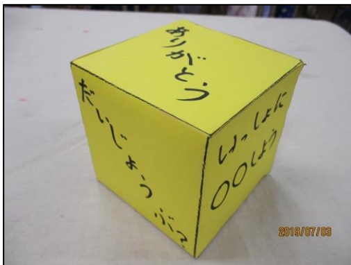
朝の会で振るサイコロ