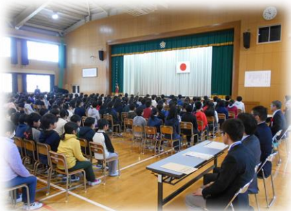
九州電力様等ご来賓の方々

学校としては、子ども達の健康増進と安全な生活を推進するために、多くの人の願いや努力が詰まった第2グラウンドを大いに活用していきたいと思っております。