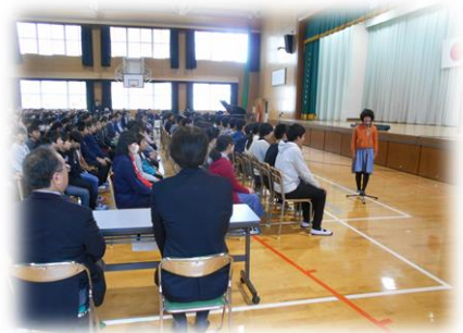
児童代表のお礼の言葉