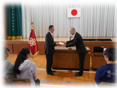
PTAから記念品の贈呈