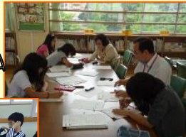
がんばろうか 難チャレンジプリント