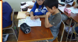
寺子屋 放課後学習