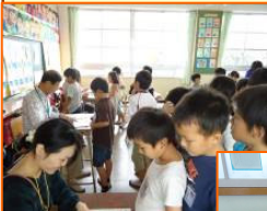
スキルタイム 縦割学習