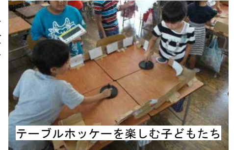
テーブルホッケーを楽しむ子どもたち

9月28日金曜日に「高取まつり」を行いました。3年生以上の学級がお楽しみの店を出して、時間を決めて各教室をまわり各学級が考えた遊びを楽しむという集会活動です。それぞれの教室では、趣向を凝らしたお店が開かれ、どの教室にも多くの子どもたちが集まってお店側もお客さん側も子どもたちは楽しそうに取り組んでいました。