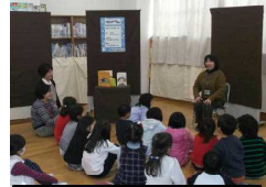
あおぞらおはなしの会