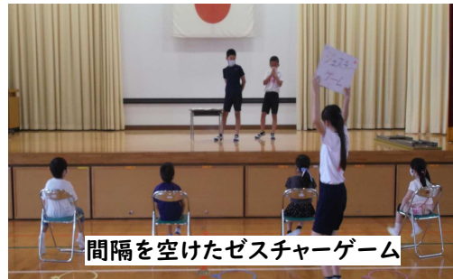
間隔を空けたゼスチャーゲーム

下校時に、1年生が6年生からもらった手作りの景品をうれしそうに手にして帰っていました。このように行事が中止になる中で6年生が取り組んだ集会活動は、これからのスタンダードとしてよいモデルになるかもしれません。ありがとう6年生。