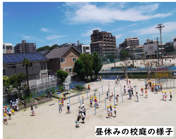
昼休みの校庭の様子

高取小学校では、この昼休みの過ごし方について先生たちが時間をかけて熱心に話し合い、今のかたちをつくりました。