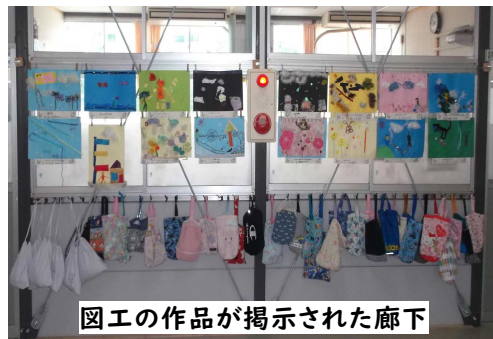
図工の作品が掲示された廊下

また、教室の中や廊下には、子どもたちの作品や1学期のめあてを書いたカードが貼られています。少しずつ少しずついつもの日常が戻ってきていることを感じられるよう