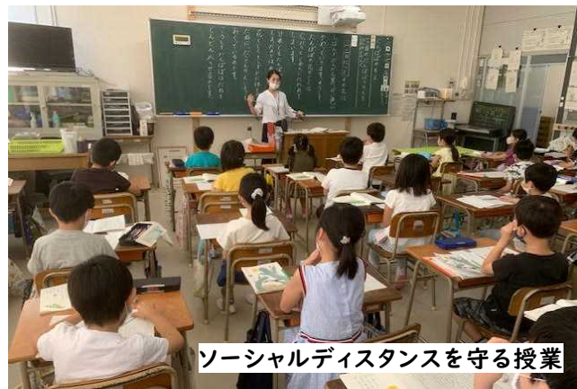
ソーシャルディスタンスを守る授業

私たちは、第二波の発生に脅えながら、これからもコロナウイルスと向き合っていくことはなりません。このことを踏まえ、現在高取小学校でも新しい生活様式が、少しずつ浸透してきています。