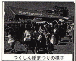
つくしんぼまつりの様子

○5月20日(日) つくし学園で、つくしんぼまつりが開催されました。 出店やイベントに訪れていた鳥飼っ子たちもみんな笑顔いっぱいでした。