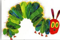
はらべごおおむし