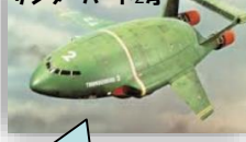
サンダーバード2号