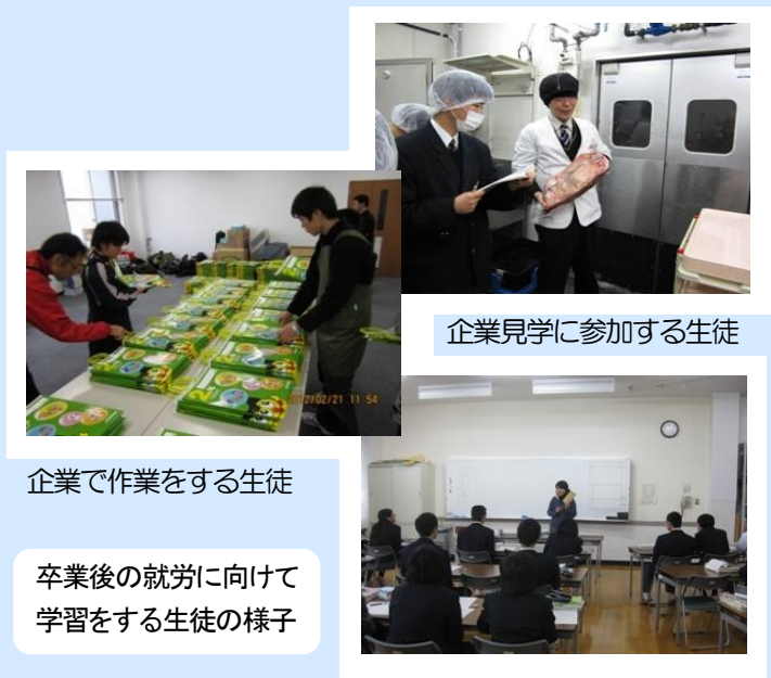
企業見学に参加する生徒

福岡市教育委員会は、企業・事業所、学校、関係機関、保護者、学識経験者等によるネットワークを立ち上げました。障がいのある市内高等部生徒の企業・事業所就職を、雇用される側(生徒)、雇用する側(企業・事業所)の両側面から捉え、推進していく取組を行っていきます。