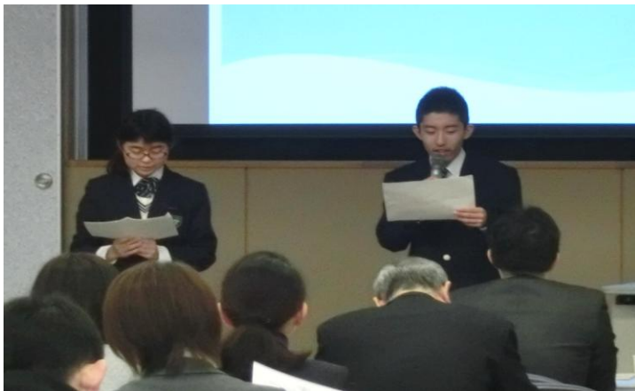
【写真(上・左)】学校紹介を行う生徒の様子。

セミナー終了後、参加生徒たちで行った振り返りでは、「他校の生徒が発表の様子を見て、とても勉強になった。」「次回もぜひ参加したい。」などの感想が寄せられました。参加者の前に立って発表したことや、他校生徒と交流したことなど、生徒たちにとって貴重な経験となったようでした。