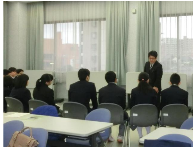
【写真(左上・下)】テレビ局のインタビューにこたえる生徒の様子。