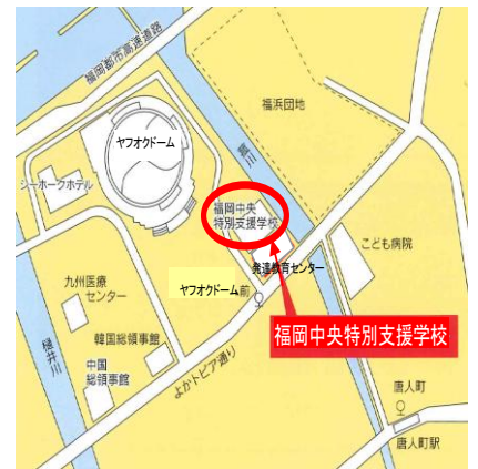
【学校 DATA】福岡市立福岡中央特別支援学校(知的障がい特別支援学校) 住所:福岡市中央区地行浜 2 丁目 1-18 TEL:092-847-2789 ホームページ: http://www.fuku-c.ed.jp/schoolhp/ ygchuo/