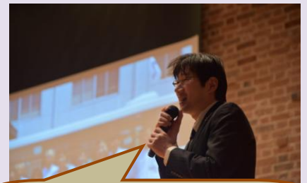
受け入れ企業、西鉄バスの担当者の方の発表

2年間にわたって取り組んできたチャレキッズプロジェクト。障がいがある、なしにかかわらず、早い段階から子どもの将来のビジョンを描きながらたくさんの経験をすること、そして子ども達の可能性について保護者だけでなく、子ども達に関わるたくさんの人たちと模索していくことが子ども達の自立や社会参加につながっていくことを改めて実感した取り組みでした。これまでたくさんの方々のご協力をいただき、本当にありがとうございました。