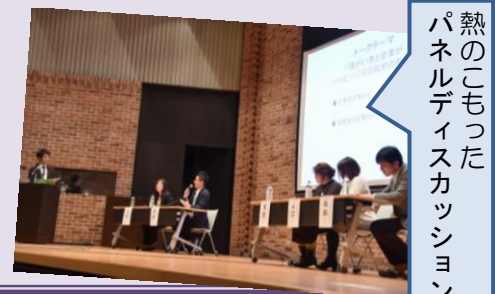
熱のこもった パネルディスカッション