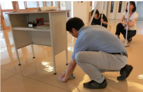
↑ 机の周りの拭き方にも一定のルールがあり、柄を机にぶつけない、机の脚に房糸を付けない、拭いたところを踏まないなどが検定の評価ポイントとなるということです。

特別支援学校の教員に向けて、清掃技能を高める研修を行いました。これは現在企画を進めている特別支援学校高等部『清掃技能検定』の一環で、まずは正しい清掃の知識とスキルを教員に体得してもらうために、福岡県ビルメンテナンス協会様のご協力のもと行われました。