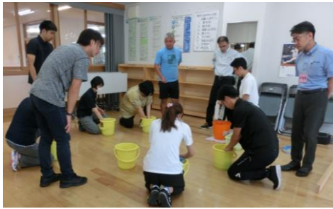
↑ モップの絞りは片膝をつき、水がバケツからこぼれないように、房糸を2~3つに分けて絞るようにします。教員からも「これならやりやすい」との声が聞かれました。