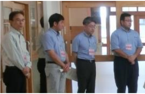
↑ 福岡県ビルメンテナンス協会の理事の方々にご指南いただきました。