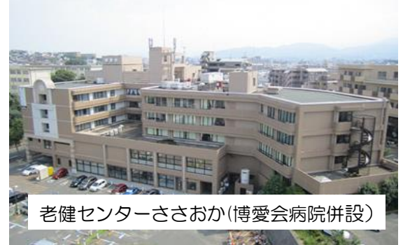
老健センターささおか(博愛会病院併設)

まずは2つのグループに分かれて施設内の見学をさせていただきました。病院と介護施設にリハビリテーションセンターを併設しており、施設の大きさ、そしてそこで働く職員の方々もかなりの数で、皆さんテキパキと働いておられる様子に圧倒されました。