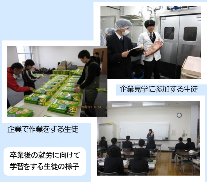
企業見学に参加する生徒

福岡市教育委員会は、企業・事業所、学校、関係機関、保護者、学識経験者等によるネットワークを立ち上げました。障がいのある市内高等部生徒の企業・事業所就職を、雇用される側(生徒)、雇用する側(企業・事業所)の両側面から捉え、推進していく取組を行っていきます。