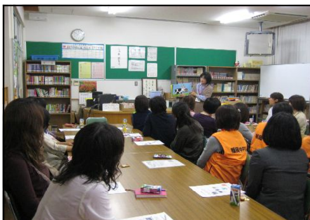
・ 絵本の読み聞かせ