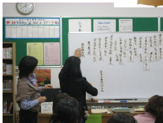
・ 俳句のアニマシオン