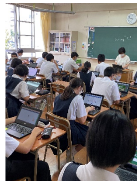
タブレットを使った授業の様子

福岡市の事業として、9月上旬に3年生に1人1台端末としてタブレット(ChromeBook)が配付されました(1、2年生は12月配付予定)。現在、子どもたちや先生は、タブレットの設定や授業での活用方法などの研修に取り組んでいます。タブレットを活用したオンライン授業は様々な学習方法の可能性を秘めているため、試行錯誤で効果的な方法を探っています。新型コロナなどにより学校が休校になった場合も、これらのタブレットを活用することができるなど、今後、学校教育でもICTを積極的に推進していくこととなります。