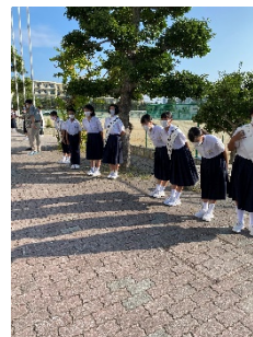
登校時の選挙運動の様子

8月下旬から1、2年生を中心として、登校時に選挙運動が行われ、9月3日(木)には、演説会や選挙が行われました。今回は、放送による演説会となりましたが、立候補者や応援演説者は、緊張の中、放送で自分の考えを伝えることができていました。特に、子どもたちの公約の中には「みんなが安心して楽しく学校に来れるような環境づくり」「地域のみなさんに愛される原中央をつくる」など学校教育の中でも最も根幹となるものを挙げていたことが印象的でした。今後も子どもたちとともに、全ての子どもたちが安心して生活することができる学校づくりを目指してまいります。