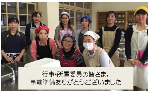
行事・所属委員の皆さま。 事前準備ありがとうございました

ちなみに、今年は、食事中に吹奏楽部の演奏がありました！サプライズ演奏について、運動部の保護者の方からは「吹奏楽部がこんな風に活動しているんだということがわかってよかった」という声が上がっていました。学習発表会を終了してかけつけた小学生からも「私、中学生になったら吹奏楽部に入りたいな」という声が聞こえてきました♪