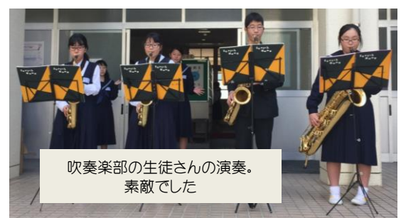
吹奏楽部の生徒さんの演奏。 素敵でした