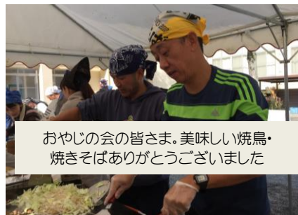
おやじの会の皆さま。美味しい焼鳥・ 焼きそばありがとうございました