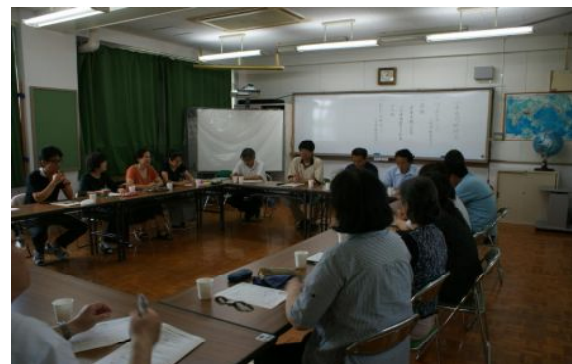
小中合同研修会で、今年度の取組内容について協議しました