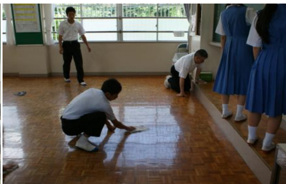
中学生の清掃活動の様子を参観していただきました