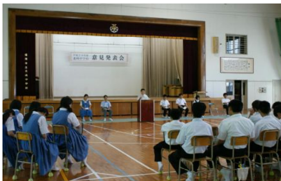
第2回意見発表の様子を参観していただきました