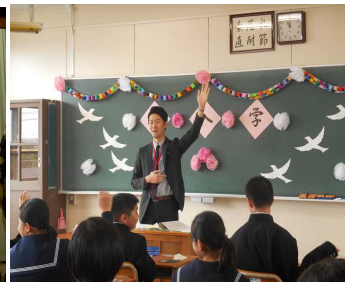
〈第50回入学式の様子〉