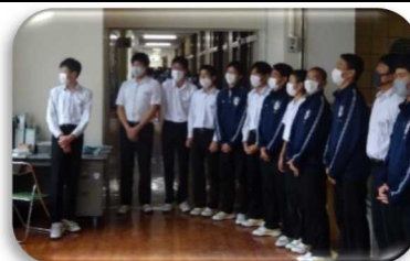
<フロアでの練習風景>

2年ぶりに合唱コンクールが開催されました。制限がある取り組みの中、実行委委員、指揮者、伴奏者、パートリーダーの皆さん、コンクールの運営や学級での歌唱指導をありがとう。仲間と一緒に何かを創り上げるときに、君たちの成長の跡がはっきりと見えてきます。