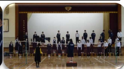
<音楽科による体育館練習風景>

動画配信後、140名ほどの保護者の方々から感動や労いの言葉、さらには来年への期待の言葉、企画に対しての改善・アドバイス等々をいただきました。ありがとうございました。