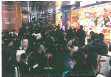
(ごった返す出発前の博多駅)

12月12日(火)から二泊三日の日程で、2年生は大阪・京都方面へ修学旅行に行ってきました。初日は、大変寒い中での出発となりましたが、新幹線で快適な移動をしました。最初の見学地であるよしもと西梅田劇場では、中央最前列を陣取り、「漫才」「新喜劇」等を食い入るように見ました。「さすがお笑いの文化！」生徒も引率した先生も「あっ」という間に笑いの渦に巻き込まれてしまいました。オープニングでは、ダンスに自信のある高宮中生徒2名と志賀中生徒1名がステージに上がり、花月のスタッフが踊るダンスに挑戦し、すっかり場が和みました。「笑い飯」等の人気漫才を聞いた後、「いそがしいうどん屋」をテーマに新喜劇を鑑賞しました。何回おなかを抱えて笑ったかわからないくらい生徒も職員も笑いました。