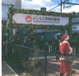
(笑いの渦：よしもと西梅田劇場)