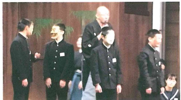
(大江能楽堂：能楽体験 意外と視野が狭いお面を体験)