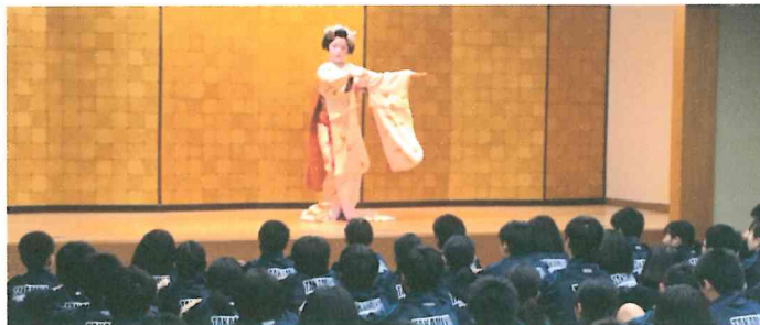
(ホテル大広間：舞子演舞と舞妓さんへの質問)