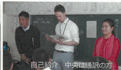
自己紹介 中央は通訳の方