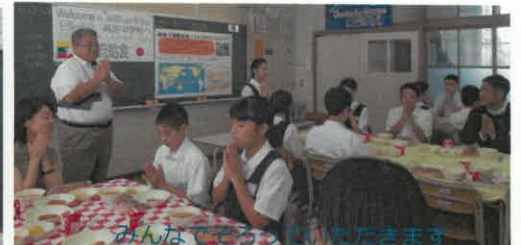
みんなであそびたいいただきます