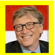
ビル・ゲイツ氏 (1955年生まれ63歳) マイクロソフト創設者 実業家 慈善活動家

「展望」という意味です。スケジュール管理を自分で行って、自分自身の行動をマネージメントします。またP(計画)D(実行)S(振り返り)サイクルを繰り返す、社会に出て活躍する力を育みます。