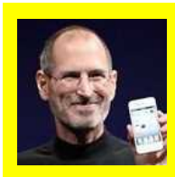
スティーブ・ジョブズ氏 (1955年～2011年) 米国の実業家 アップル社の創業者

スティーブ・ジョブズという人を知っていますか。iPhone や iPad を作った人です。スマートフォンの産みの親と言えるでしょう。ジョブズは、すでに亡くなっていますが、彼の子育てについて、アメリカの新聞「ニューヨークタイムズ」(2014年)に、こんな記事があります。