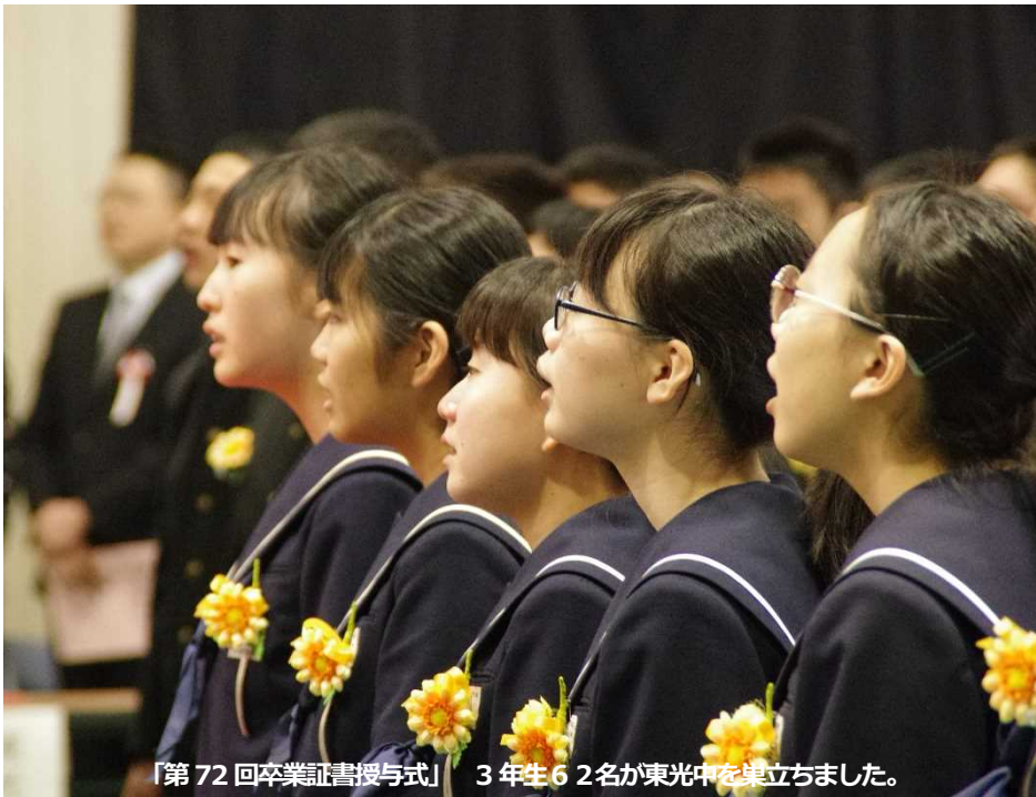
「第72回卒業証書授与式」 3年生62名が東光中を巣立ちました。