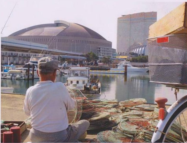
中学生の部 最優秀賞「伊崎漁港から見えるぼくの校区」