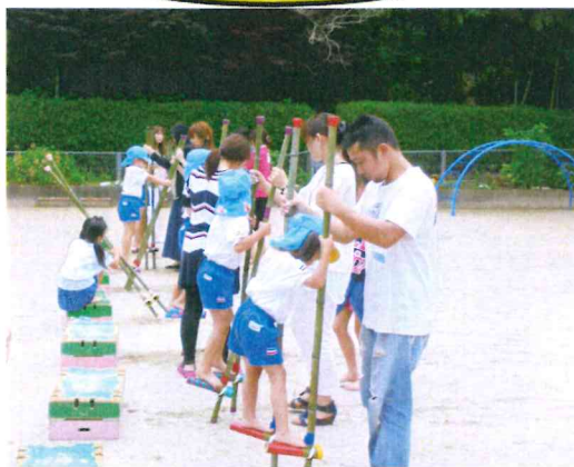
おうちの人に作ってもらった竹馬を一生懸命 練習する子どもたち