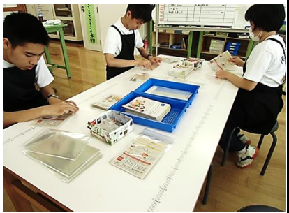
受託作業(チラシの封入)

1階食品加工室前廊下では、弁当袋・エコバッグ・シュシュ・ポケットティッシュケースなどの販売もいたしますので、ぜひお越しください。