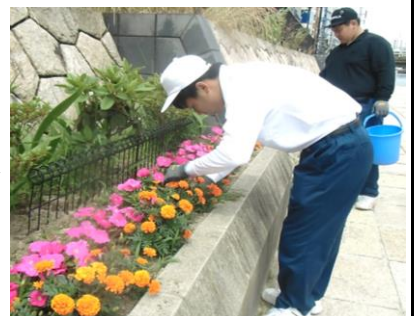
博多川花壇の手入れと遊歩道の清掃