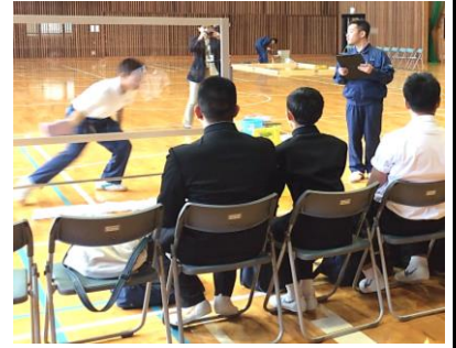
清掃体験(清掃検定用窓枠)

「洗車」グループは、チームで協力しながら、シャンプー洗車、ワックスかけ、車内清掃を手順に従って仕上げていきます。お気軽にお立ち寄りください。