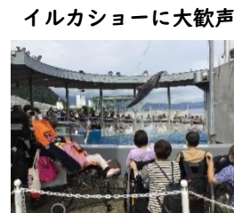
イルカショーに大歓声