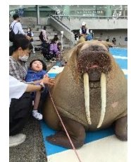
セイウチにタッチ