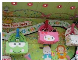
ハーモニーランド たのしかった！