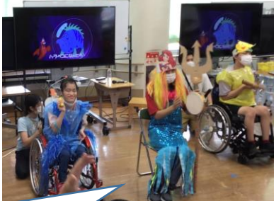
＜学習活動の「コマより」＞

今日、7月21日(木)で、1学期が終わりました。みんなたくさんのお勉強、がんばりましたか？みんなが大好きなプールは、人数制限をしながらですが実施できました。こいのぼり見学のほか、校外学習にも出かけましたね。コロナの感染拡大が心配ですが、夏休み、ゆっくり身体を休めると同時に、たくさんの楽しいことや新しいことにもチャレンジして、思い出をいっぱい作ってください。2学期の始業式は、8月29日(月)です。元気に始業式で会いましょう！